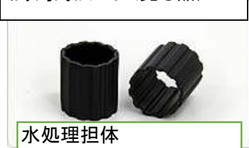
水処理担体 クレオチューブ