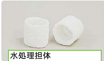
水処理担体 ラメールチューブ