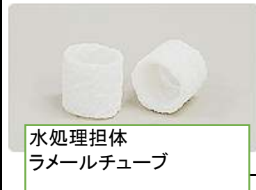
水処理担体 ラメールチューブ