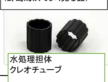
水処理担体 クレオチューブ