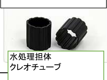
水処理担体 クレオチューブ