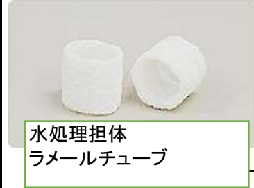
水処理担体 ラメールチューブ