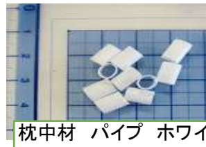
枕中材 パイプ ホワイト