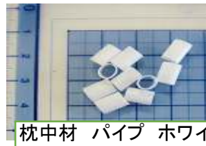
枕中材 パイプ ホワイト