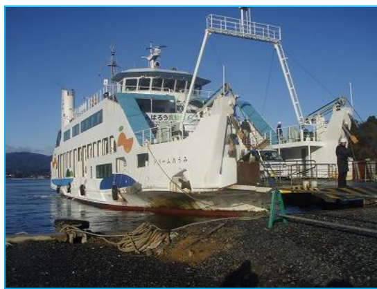
気仙沼～大島フェリー