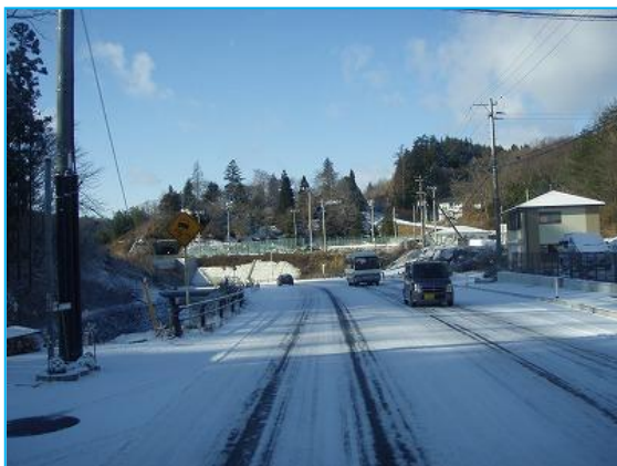
初積雪の気仙沼でした。