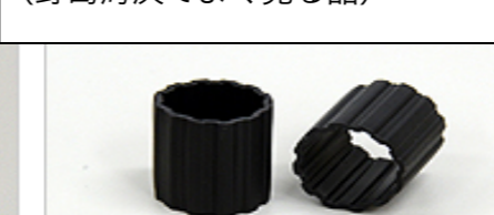
水処理担体 クレオチューブ