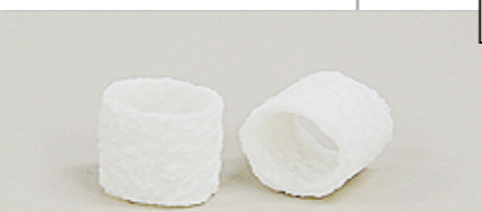
水処理担体 ラメルチューブ