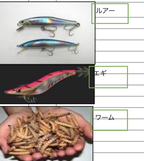
ルアー エギ ワーム