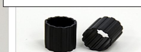
水処理担体 クレオチューブ