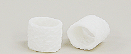
水処理担体 ラメールチューブ