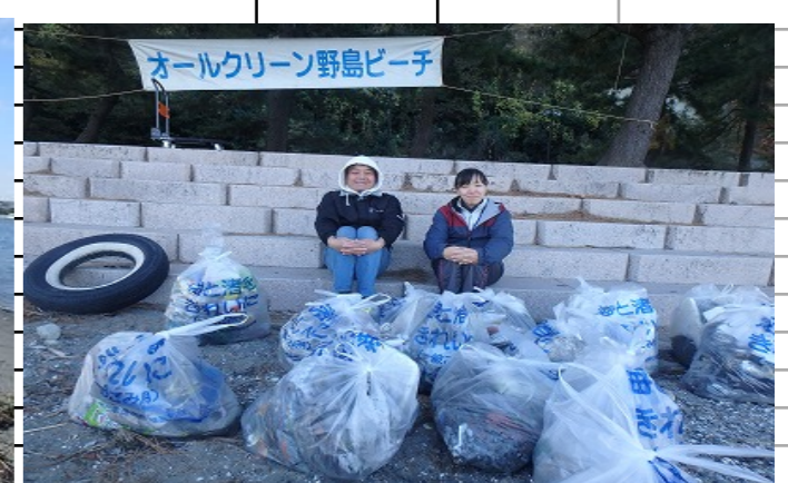
オールクリーン野島ビーチ